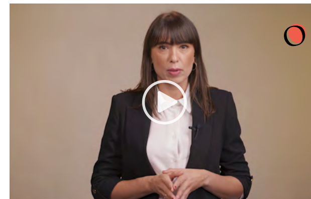
Consejos para no malgastar

Otra emoción que puede influir es la culpa , la cual surge cuando, en algún momento, hemos tomado decisiones que han sido erróneas, por ejemplo, cuando hemos gastado de forma excesiva o nos hemos endeudado de forma irresponsable.